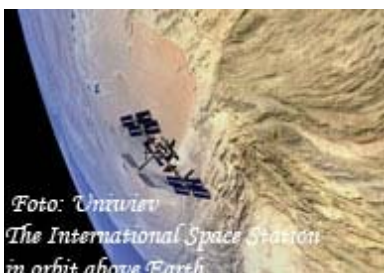
The International Space Station in orbit above Earth